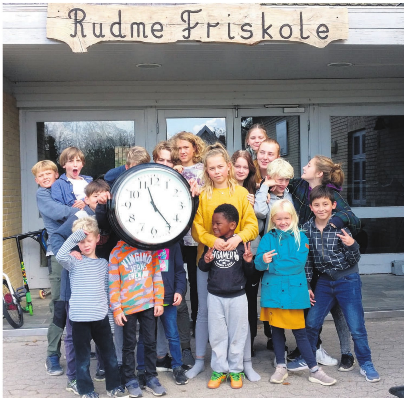
Ugens klummeskribent filosoferer over begrebet "tid" i denne uges klumme.

så at bevæge børnene og give dem mulighed for at nyde tiden. Mandag morgen har jeg bestemt, at hele skolen skal på morgenmotions-tur. Børnene var lidt skeptiske de første to gange. Vi har også filosofi, matematik, dansk, svømning og mange andre fag. Alt er bestemt og besluttet, for i barndommens land er det de voksne, der hersker.